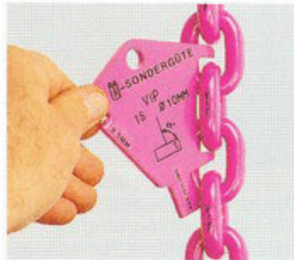
Prüfen Plastische Längung durch Überlast